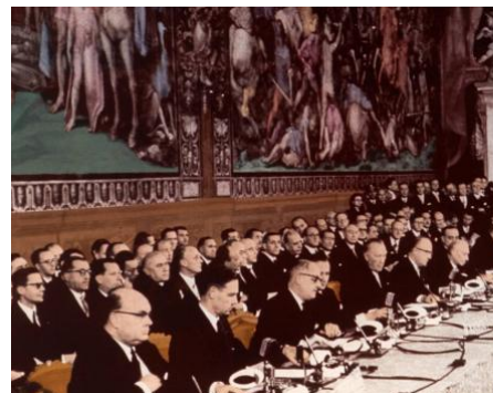
③ Traité de Rome