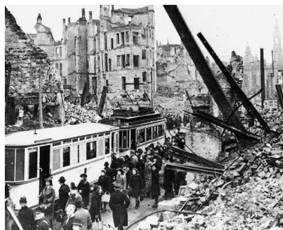
② Seconde Guerre mondiale