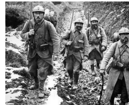
④ Grande Guerre