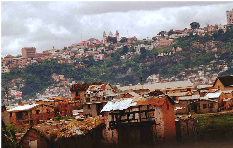
Vue d'Antananarivo, février 2012, Site de Soahary, blogueuse malgache, page consultée le 13/10/16