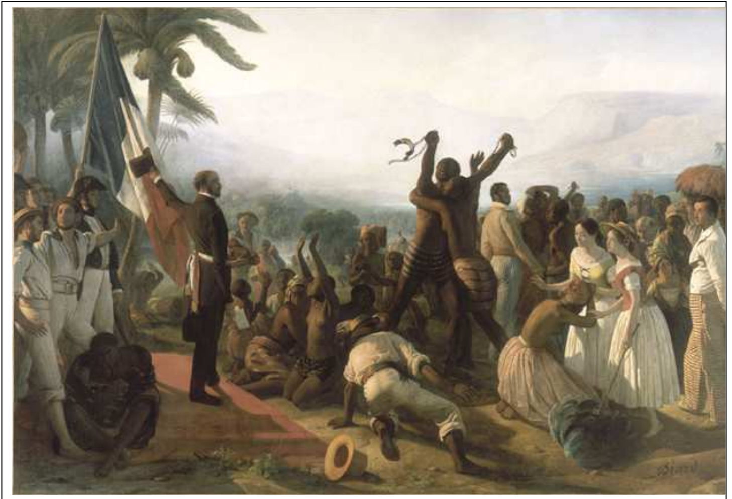
François Biard, L'abolition de l'esclavage dans les colonies françaises en 1848 , huile sur toile (Salon 1849) Versailles, musée national du château et de Trianon, MV 7382