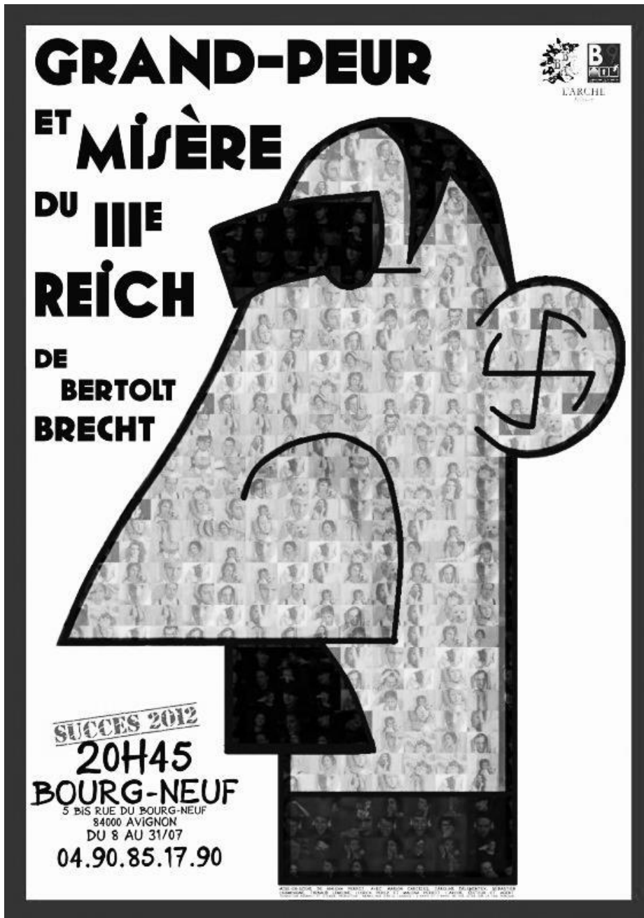
Affiche de la compagnie de théâtre Branle-Bas d'Arts Conception affiche : Edouard Tavinor et Malena Perrot